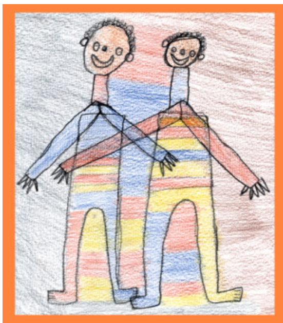
Piirros: Jack Heiskanen